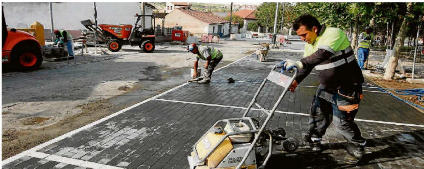
Obras para rejuvenecer el casco antiguo del barrio de Tejares, que comenzaron el pasado enero y se prolongarán hasta principios del próximo año.